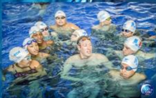
Alain Bernard, au milieu des enfants de Puteaux pour la Nuit de l'Eau 2013