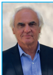
Jean-Marie Dru Président de l'UNICEF France

25 experts ont accepté de partager le fruit de leur réflexion afin de questionner, chacun dans leur domaine, l'effectivité des droits des enfants en France, en 2015. La seule réflexion qui doit guider pouvoirs publics comme société civile est finalement bien celle qui conduit à mesurer les écarts entre les droits formels et les droits réels des enfants.